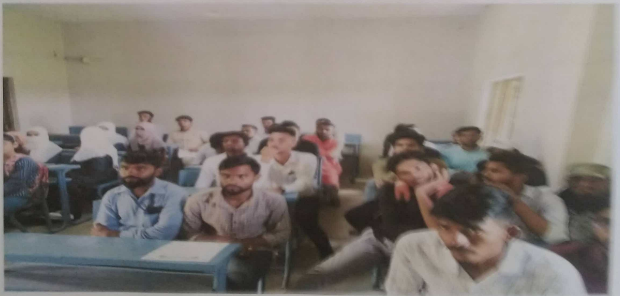
भूगोल दिनाच्या कार्यक्रमात सहभागी विद्यार्थी