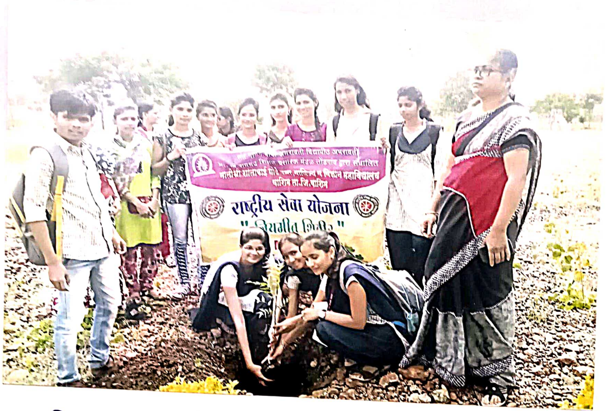
महाविद्यालय परिसर वृक्षारोपण करताना राशेयो स्वयंसेवक