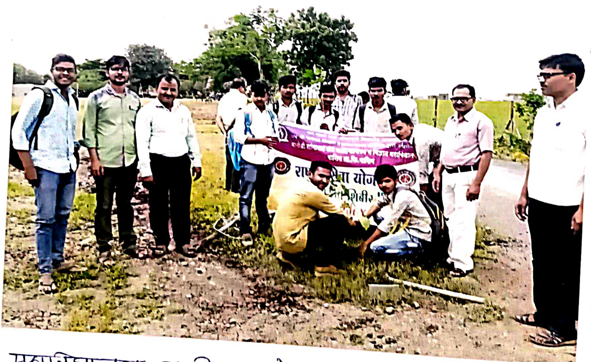
महाविद्यालय परिसरमध्ये वृक्षारोपण करताना राशेयो स्वयंसेवक

N.S.S. Programme Office Matoshri Shantabai Gote College Washim