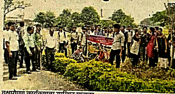
वृक्षारोपण कार्यक्रमाला उपस्थित मान्यवर.

महाराष्ट्र शासनाच्या १३ कोटी वृक्ष लागवड कार्यक्रम या विशेष मोहिमेतर्गत या महाविद्यालयामध्ये हा कार्यक्रम घेण्यात आला. याप्रसंगी महाविद्यालय परिसरामध्ये कडुलिंब, सप्तपर्णी, आवळा, चिंच या सारख्या विविध जातींची एकूण ५० रोपे लावण्यात आली. या सर्व रोपांचे संवर्धन तथा संरक्षण करण्याची जबाबदारी राष्ट्रीय सेवा योजना पथकातील स्वयंसेवकांनी स्वीकारली