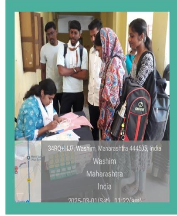
34RQ+HJ7, Washim, Maharashtra 444505, India Washim Maharashtra India 2025-03-01(Sat) 11:22(am)