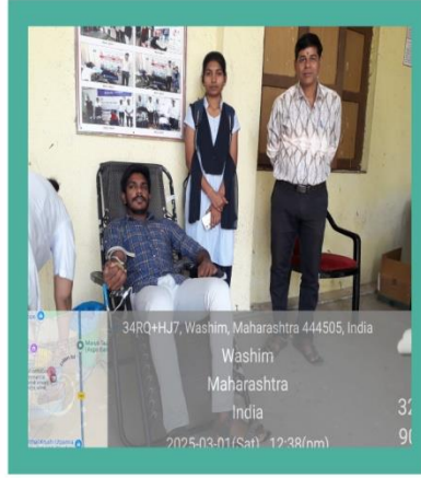
34RQ+HJ7, Washim, Maharashtra 444505, India Washim Maharashtra India 2025-03-01(Sat) 12:38(pm)