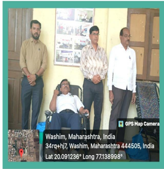
Washim, Maharashtra, India 34rq+hj7, Washim, Maharashtra 444505, India Lat 20.091236° Long 77.138998°