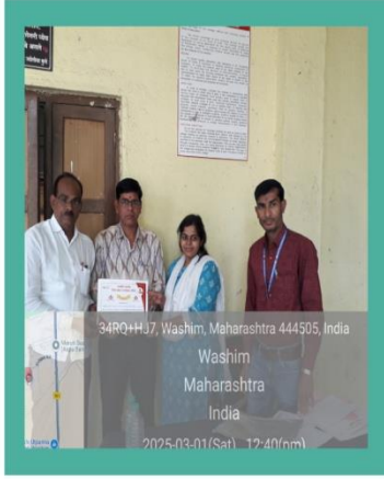
34RQ+HJ7, Washim, Maharashtra 444505, India Washim Maharashtra India 2025-03-01(Sat) 12:40(pm)