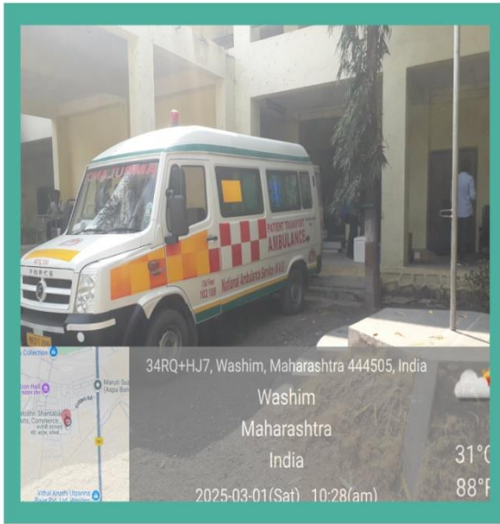
34RQ+HJ7, Washim, Maharashtra 444505, India Washim Maharashtra India 2025-03-01(Sat) 10:28(am)