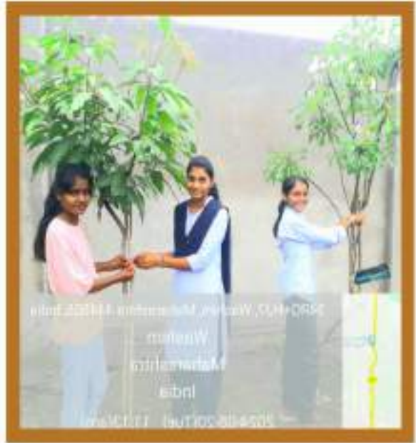
महाविद्यालयातील युवक युवतींनी बांधल्या वृक्षांना राख्या